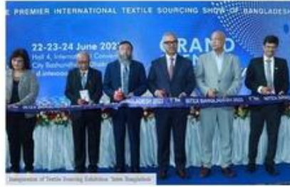
Inauguration of Textile Sourcing Exhibition 'Intex Bangladesh'