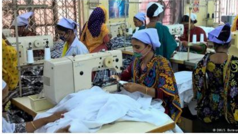
তৈরি পোশাক শিল্প (ফাইল ছবি)

বস্ত্র ও পাটমন্ত্রী গোলাম দস্তগীর গাজী বলেছেন, দেশে ও বিদেশে আন্তর্জাতিক প্রদর্শনী ও পারস্প