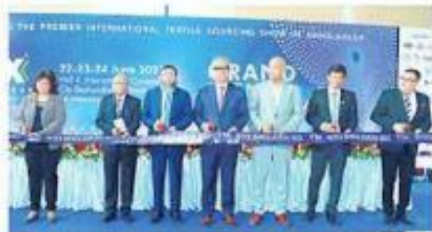
বসুন্ধরা আন্তর্জাতিক কনভেনশন সেন্টারে প্রদর্শনী