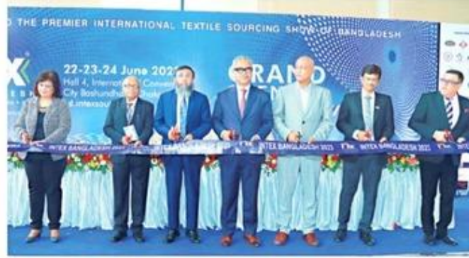
বৃহস্পতিবার বসুন্ধরা আন্তর্জাতিক কনভেনশন সেন্টারে ইন্টেক্স সাউথ এশিয়া প্রদর্শনীর উদ্বোধন অনুষ্ঠানে অতিথিরা

ঢাকায় টেক্সটাইল খাতের আন্তর্জাতিক টেক্সটাইল সোর্সিং প্রদর্শনী 'ইন্টেক্স সাউথ এশিয়া ২০২৩' শুরু হয়েছে। বৃহস্পতিবার বসুন্ধরা আন্তর্জাতিক কনভেনশন সেন্টারে প্রদর্শনীর উদ্বোধন করেন বঙ্গ ও পাটমন্ত্রী গোলাম নব্বীগীর পাণ্ডে।