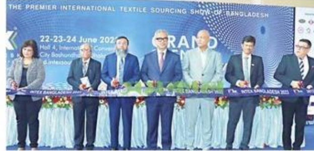
বৃহস্পতিবার বসুন্ধরা আন্তর্জাতিক কনভেনশন সেন্টারে ইনটেক্স সাউথ এশিয়া প্রদর্শনীর উদ্বোধন অনুষ্ঠানে অতিথিরা ফটো রিলিফ

ইনটেক্স বাংলাদেশের প্রদর্শনীর পাশাপাশি চারটি সেমিনার ও প্যানেল আলোচনা অনুষ্ঠিত হবে।