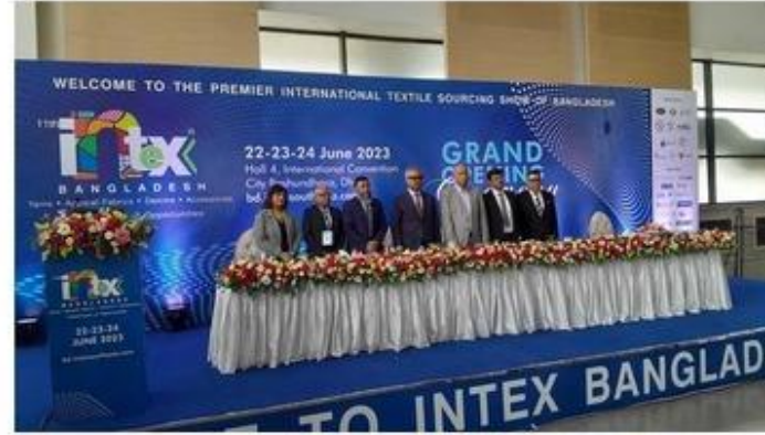
শুরুতে আঞ্চলিক কনভেনশন সেলারে আয়োজিত প্রদর্শনীরে মন্ত্রিপরিষদ সচিব উপস্থিত অতিথিরা।

ঢাকায় শুরু হয়েছে 'ইন্টেক্স বাংলাদেশ ২০২৩' প্রদর্শনী। সাউথ এশিয়া টেক্সটাইল সোর্সিংয়ের উদ্যোগে আয়োজিত হয়েছে এই আঞ্চলিক প্রদর্শনী।